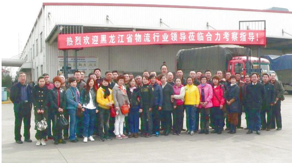
黑龙江大客户来公司考察