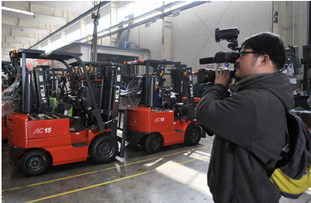
媒体聚焦“安徽合力”