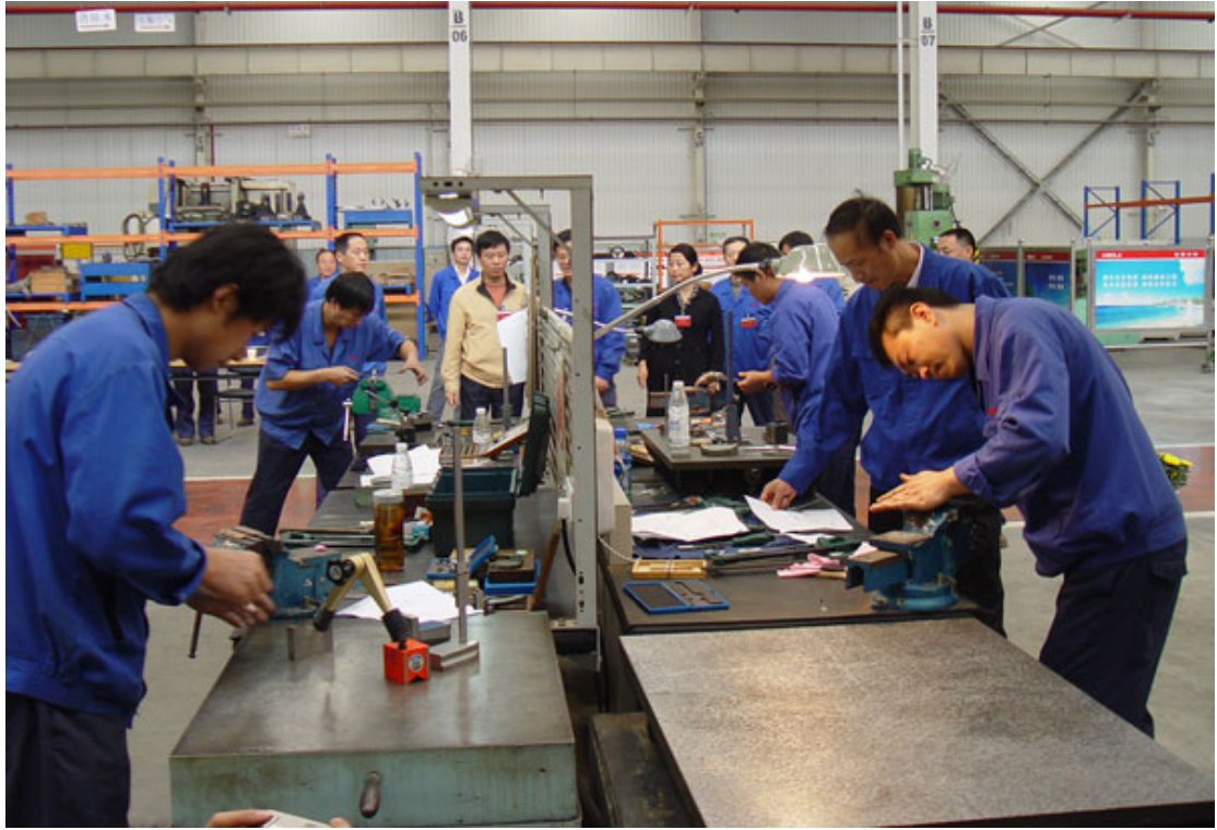
公司高技能人才“比武”