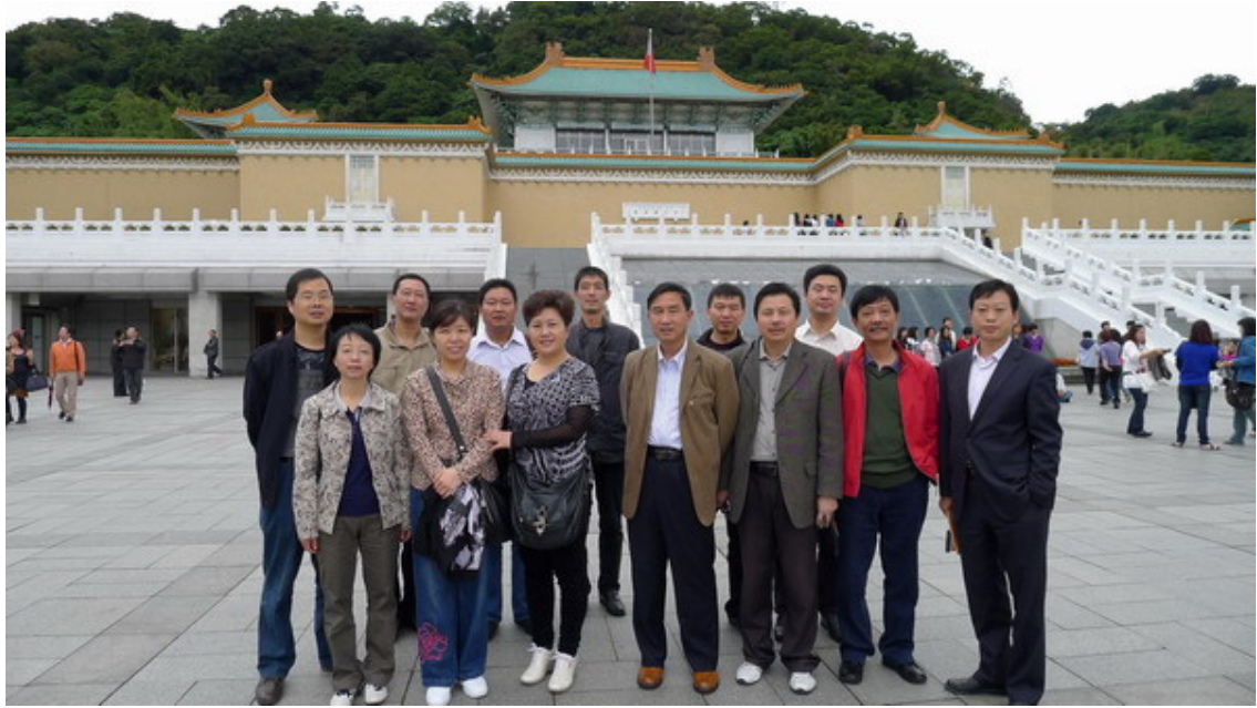
公司组织劳模赴台湾旅游