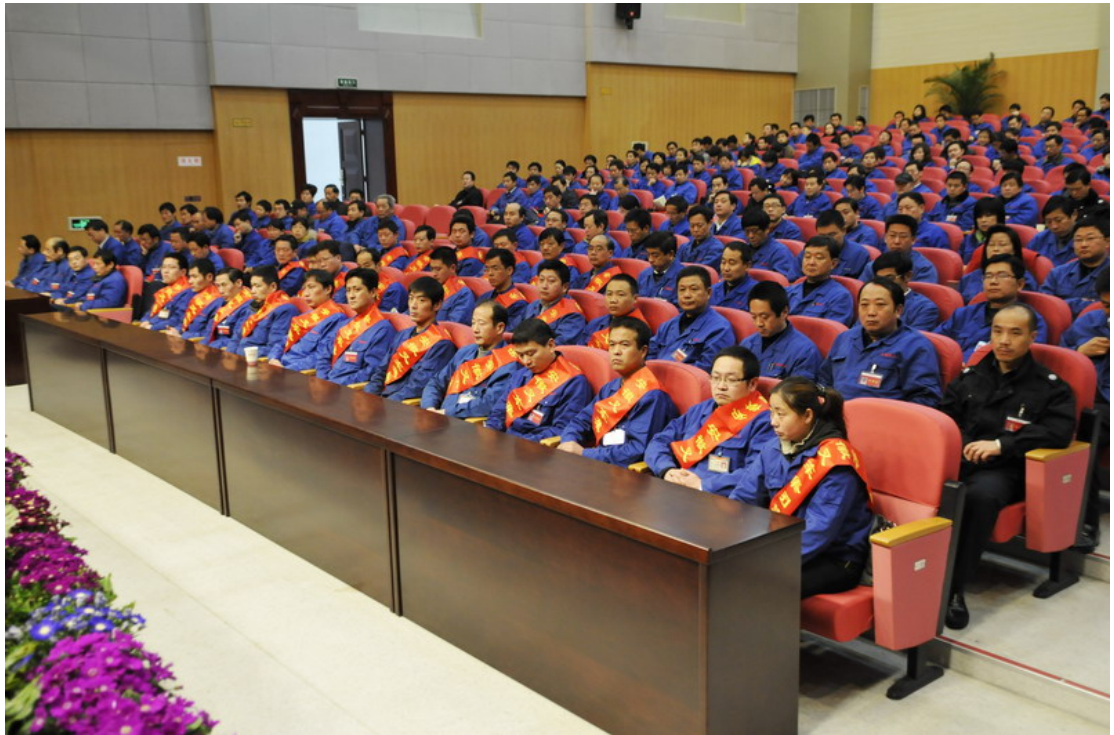
公司表彰优秀员工