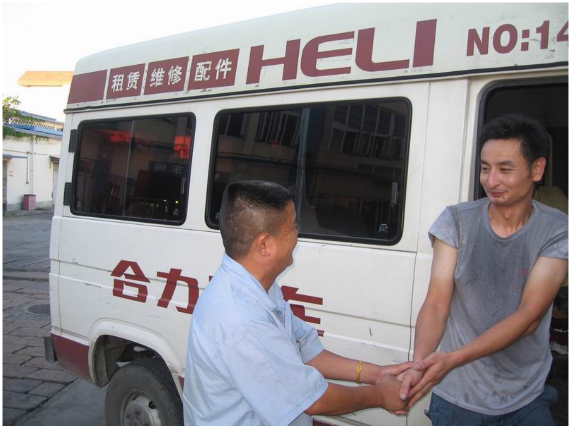
公司开展“售后服务月”活动