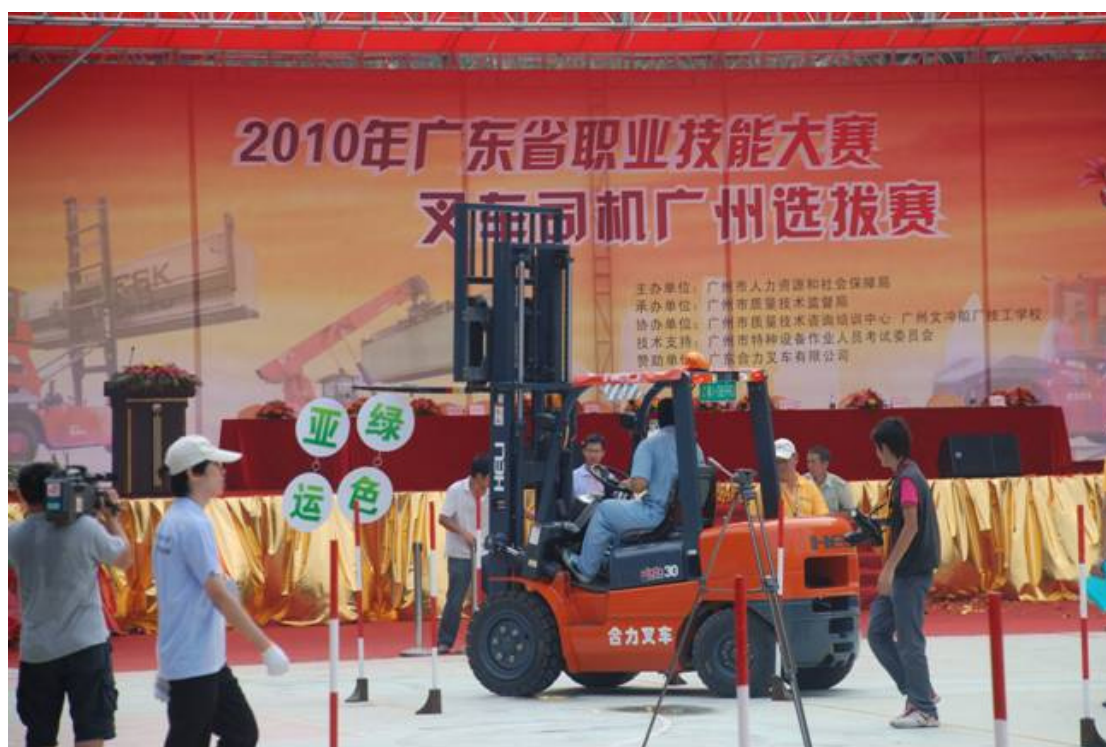
“合力叉车”参加 2010 年广东省“省长杯”职业技能竞赛

(4) 培训指导。公司秉承客户至上的优良传统，产品到哪，操作培训、技术指导就跟到哪。全年共计为用户现场培训近六万次，并集中为用户进行技术培训，同时举办多期培训班，集中培训维修专业技术。为提高海外经销商的售后服务能力，公司采取走出去和请进来的方式对经销商及最终客户进行培训，全年为俄罗斯、巴西、孟加拉和伊朗等经销商培训售后服务技术人员 10 多人次。