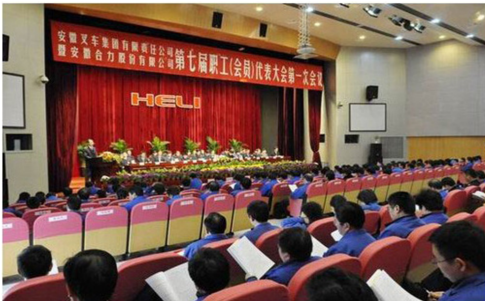
公司七届一次职工代表大会

2010年，公司第六届职工代表大会提案整改工作小组，整改落实提案52条，占全部提案的77.61%，并对暂时无法整改和不便整改的提案向职工代表进行了详细的说明。职工代表组长和工会委员联席会审议通过了《关于调整职工工龄工资》、《关于提高职工误餐补贴》等决议，有效保障了职工合法权益。