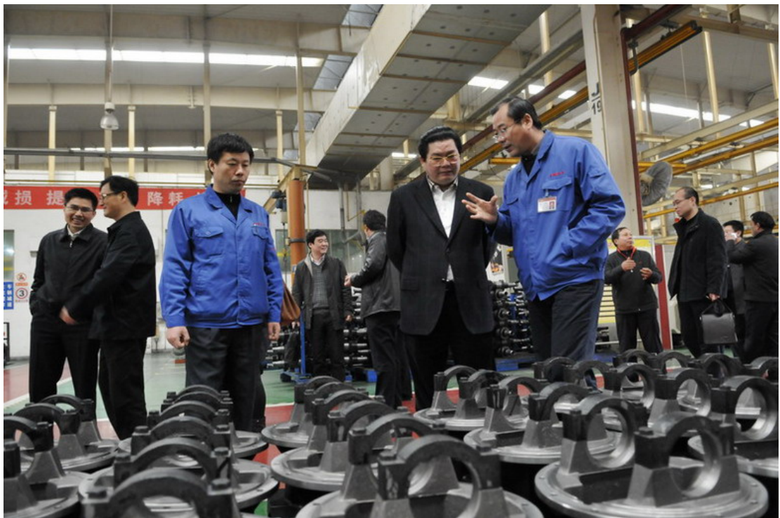
国家安监总局四司司长欧广来公司调研