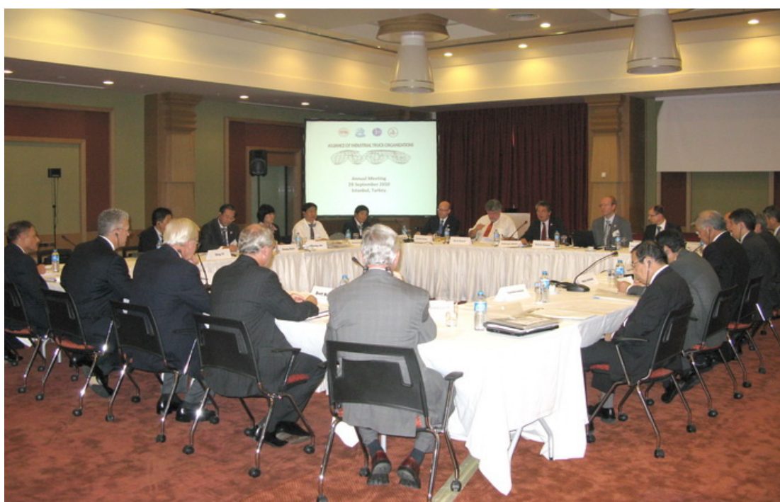
公司参加第十三届世界工业车辆联盟会议暨欧洲 FEM 2010 年年会

(4) 承担政府项目。2010 年,公司积极承担国家级技术中心创新能力建设项目、国家火炬计划项目、国家自主创新产品计划项目、安徽省十大产业技术攻关项目、安徽省技术创新专项资金项目及安徽省高新技术产品计划项目等,其中有 2 项分别获得安徽省科技进步一等奖、合肥市科技进步二等奖。