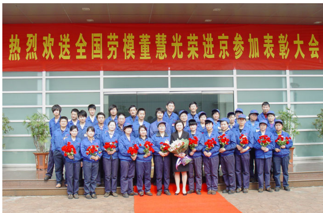
欢送全国劳模进京

公司坚持“人才强企”战略，为公司可持续发展提供人力资源支持。为此，公司加快人才梯队培养，建立了包括在职大专班、本科班、硕士班、博士班在内的多层次教育深造体系。2010 年通过持续培训公司员工共完成精益改善提案近四千条，5S 平均得分上升到 85 分，获得全国质量优秀管理小组 2 项、省机械系统职工技术创新优秀成果 3 项、省工人先锋号 1 个、省模范班组 1 个、省技术创新示范班组 1 个、省技术创新能手 1 人。