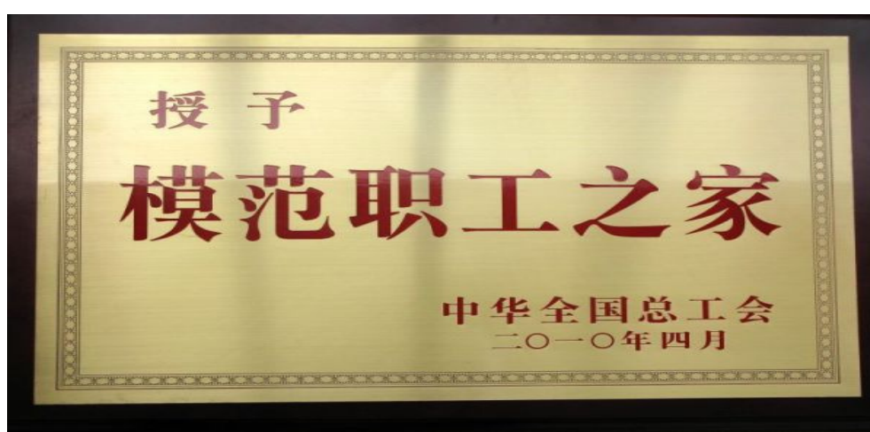
宝鸡分厂荣获“全国模范职工之家”