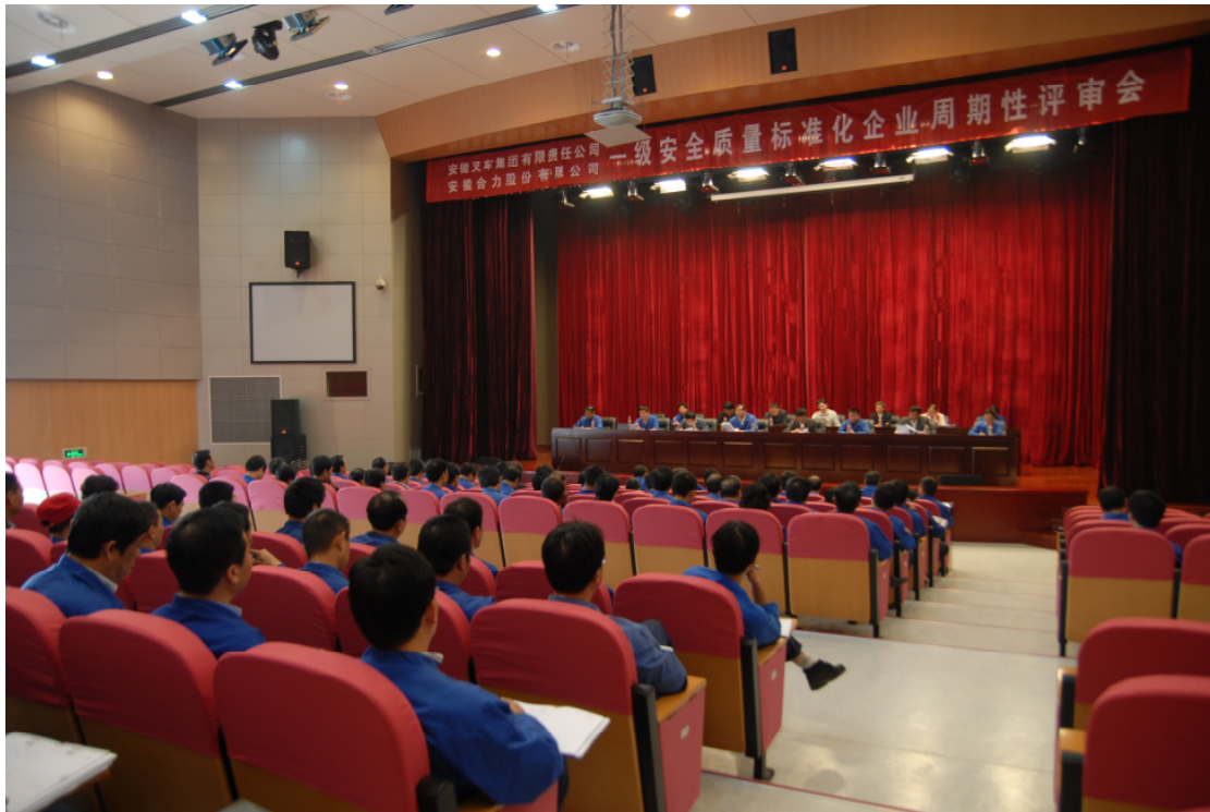
公司通过国家一级安全质量标准化企业复审