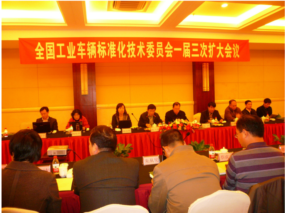
公司参加全国工业车辆标准化技术委员会会议