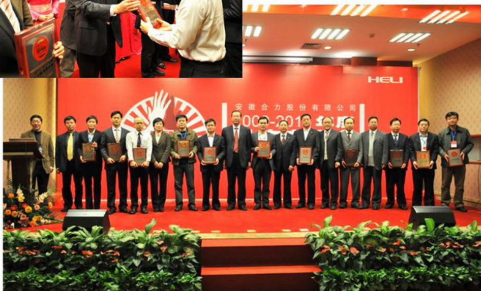
图为 2010 年度公司供应商大会