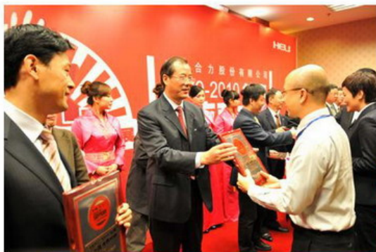
公司领导和中国工业车辆分会领导为优秀供应商授牌