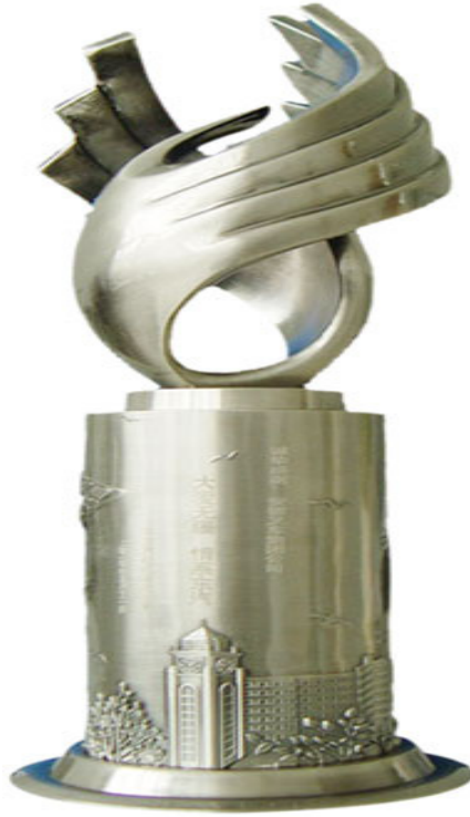
东方汽轮机有限公司赠与“合力”象征伟大抗震救灾精神的纪念杯

支援灾区人民，关心弱势群体，真诚奉献爱心。2010年，公司积极响应省政府号召，全年对外公益活动和捐赠总额112万元，用于青海玉树地震、西南特大干旱、对口支援新疆等活动。